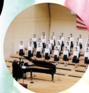
熊本県立第一高校合唱団

公演日・Date | 2024.06.19(水) 開演19:00 (18:20入場)