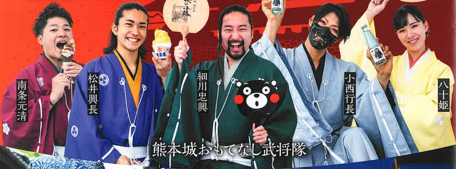
熊本城おもてなし武将隊

この夏の「桜の小路」は、夏色グルメ&お土産や夜市の開催、レンタルゆかたスタートなど、楽しみがいっぱい！まるでおまつりのような賑やかさです。熊本城おもてなし武将隊も夏の「桜の小路」に夢中！！